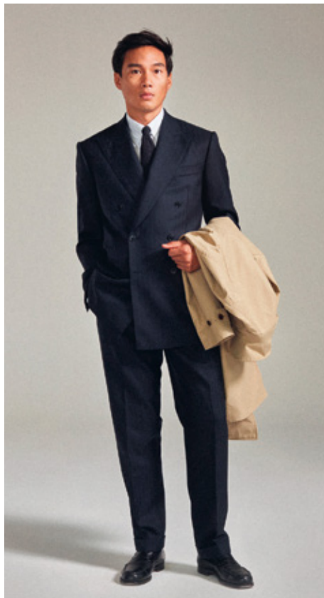
Désormais, Swann propose un vestiaire complet inspiré du style Ivy des années 50-60.